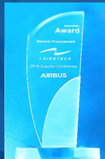
2019 AIRBUS Innovation Award