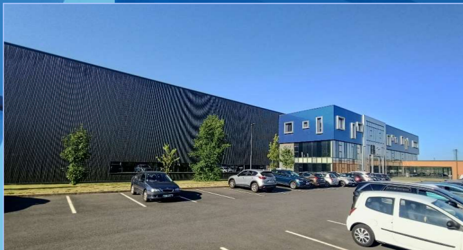
Usine de Bouguenais