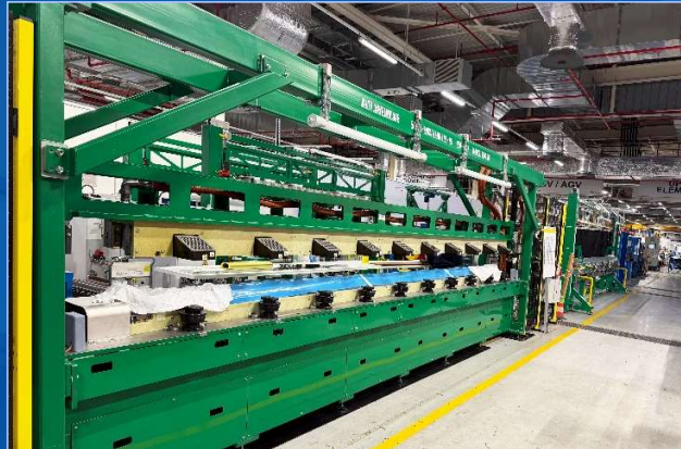
Lignes de production