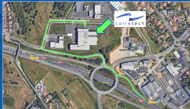
Accès périphérique Nantes sud porte de Retz