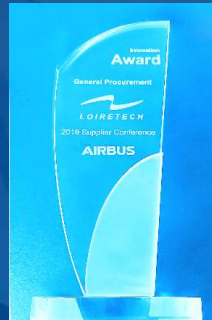
2019 AIRBUS Innovation Award